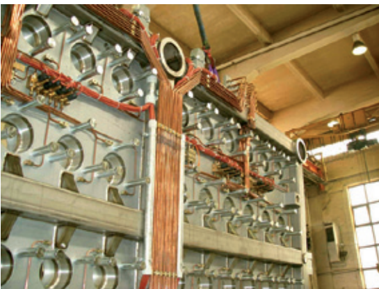
Detailansicht Öl- und Luftversorgung Details of oil and air supply