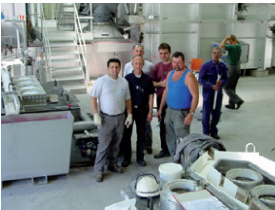
Inbetriebnahme / Ausbildung Commissioning / Education